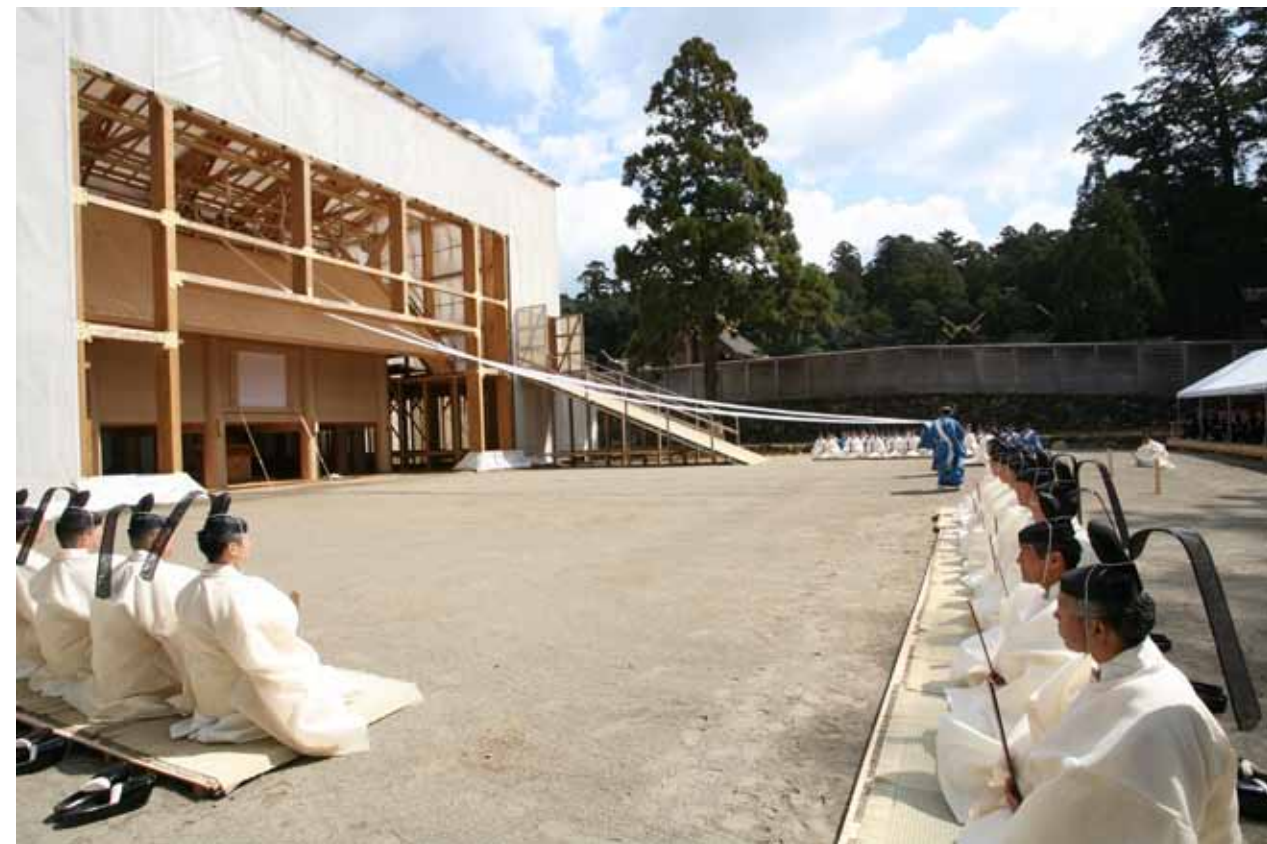
平成24年(2012)3月26日 内宮 26 March 2012 Naiku