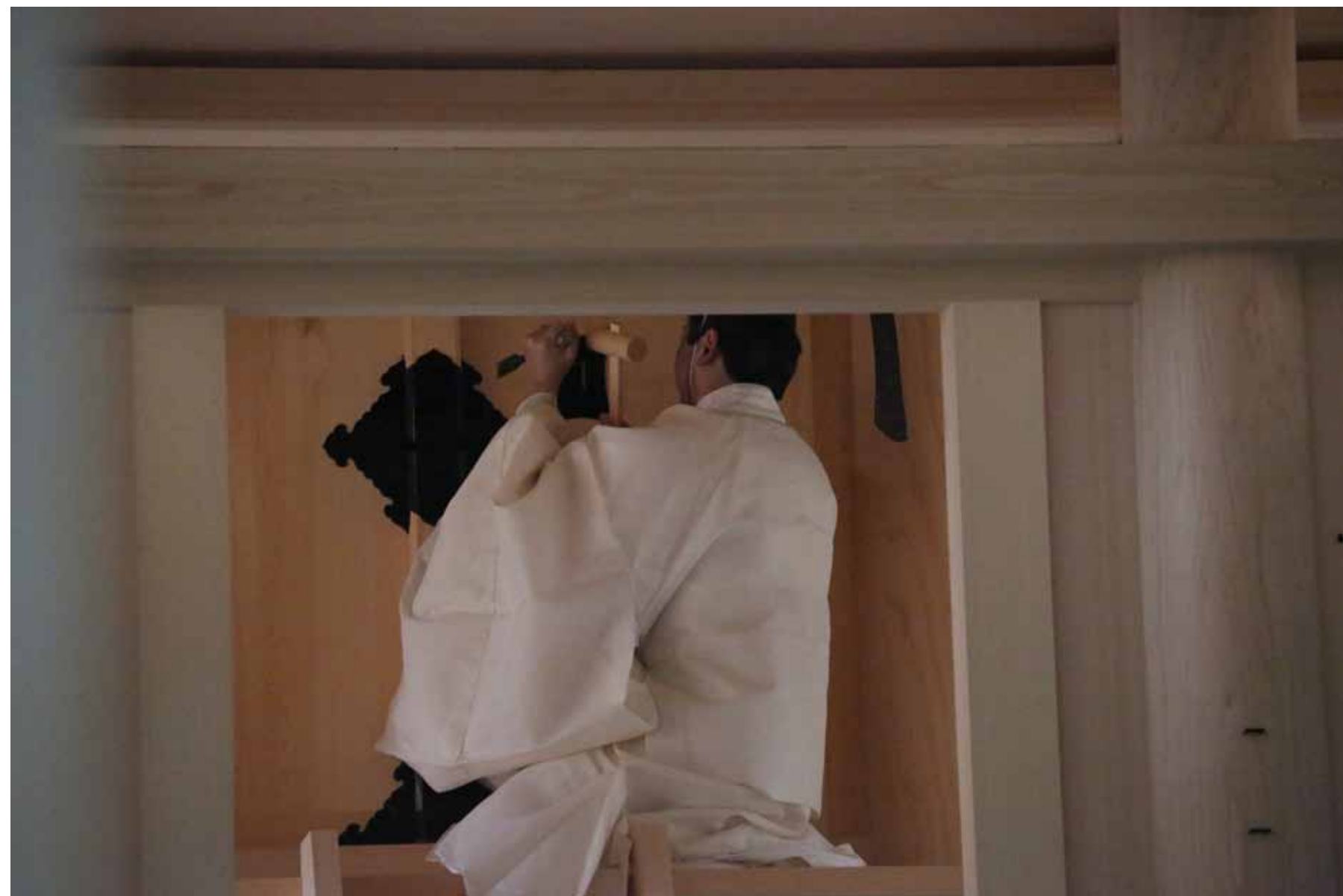
つきよみのみや 月夜見宮 Tsukiyomino-miya