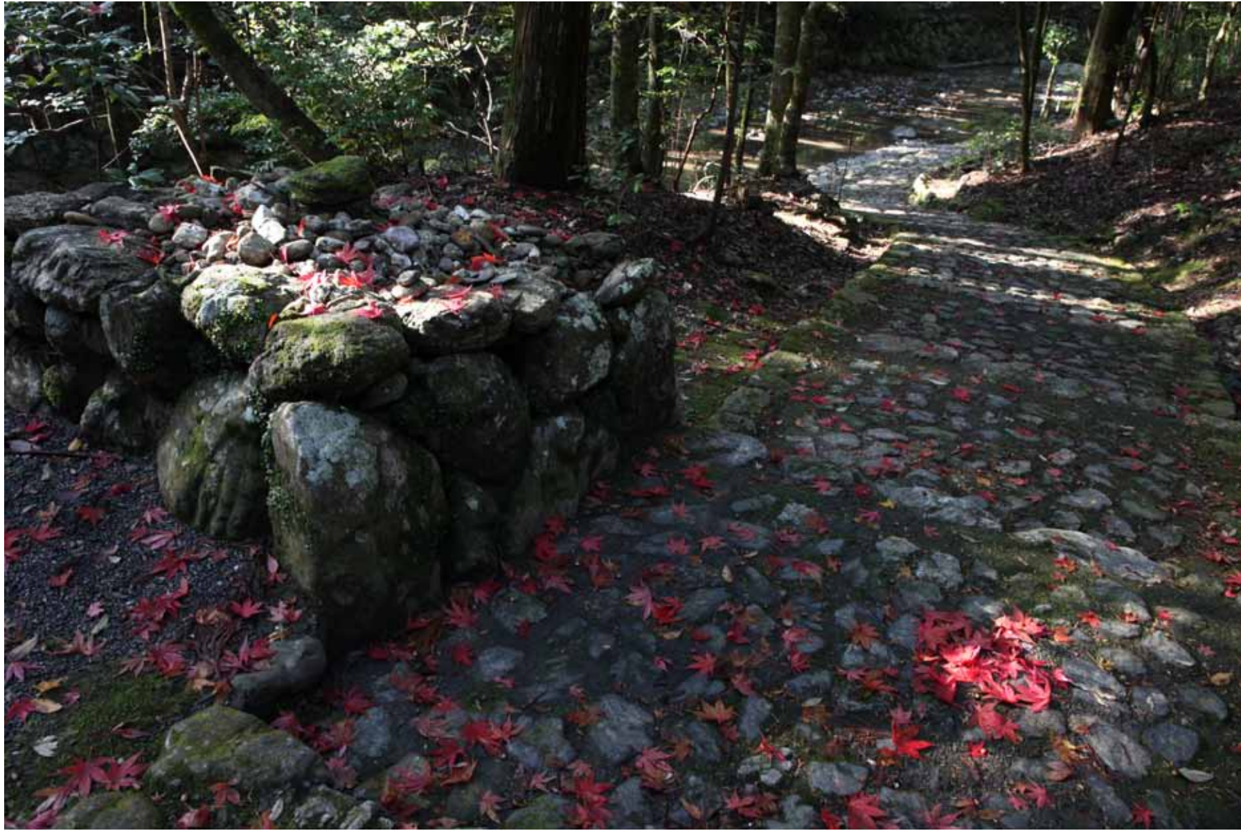
たきはらのみや 瀧原宮 Takiharano-miya

平成26年(2014)11月30日 参道 30 November 2014 Approach way