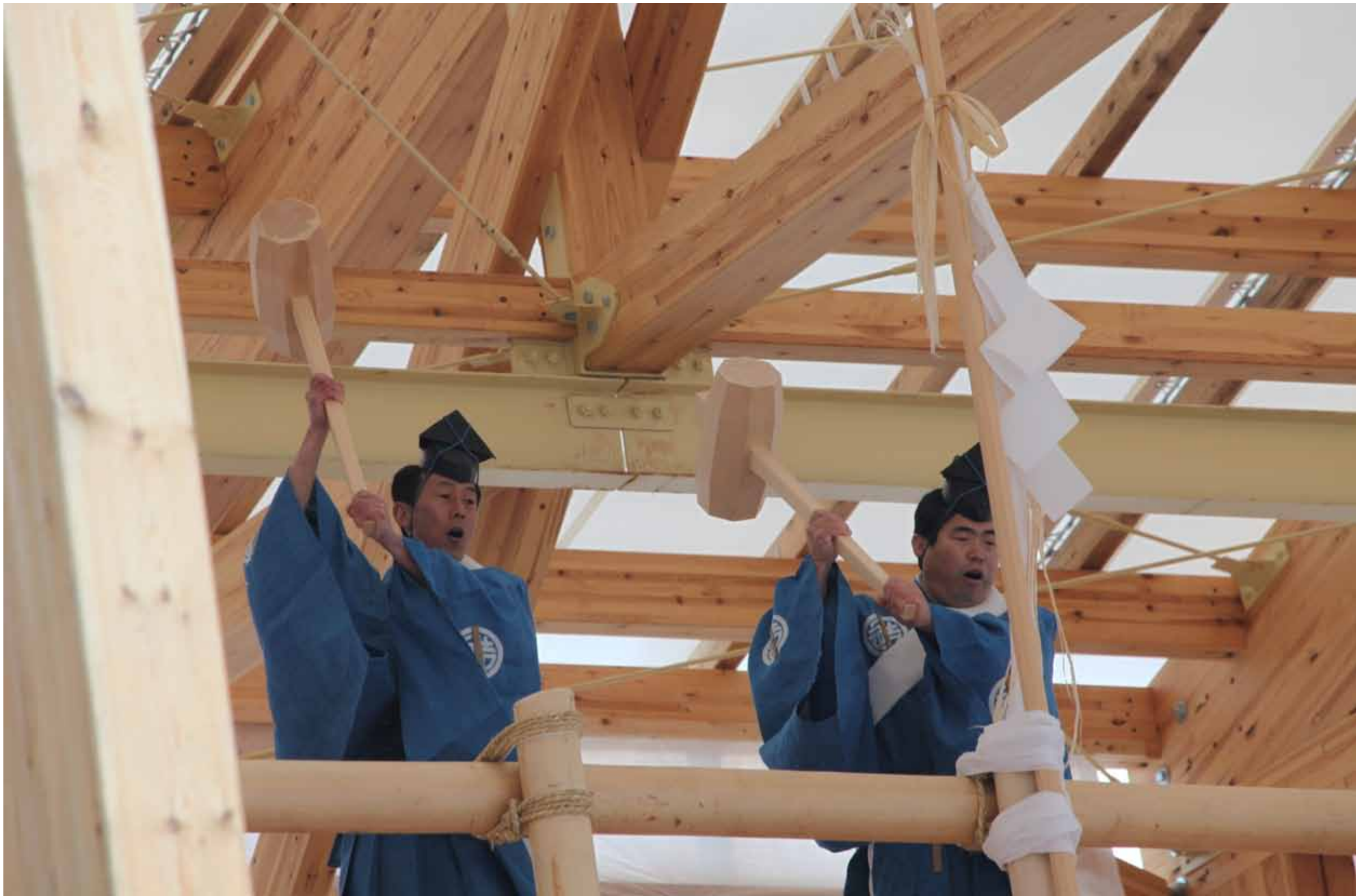
平成24年(2012)3月26日 内宮 26 March 2012 Naiku