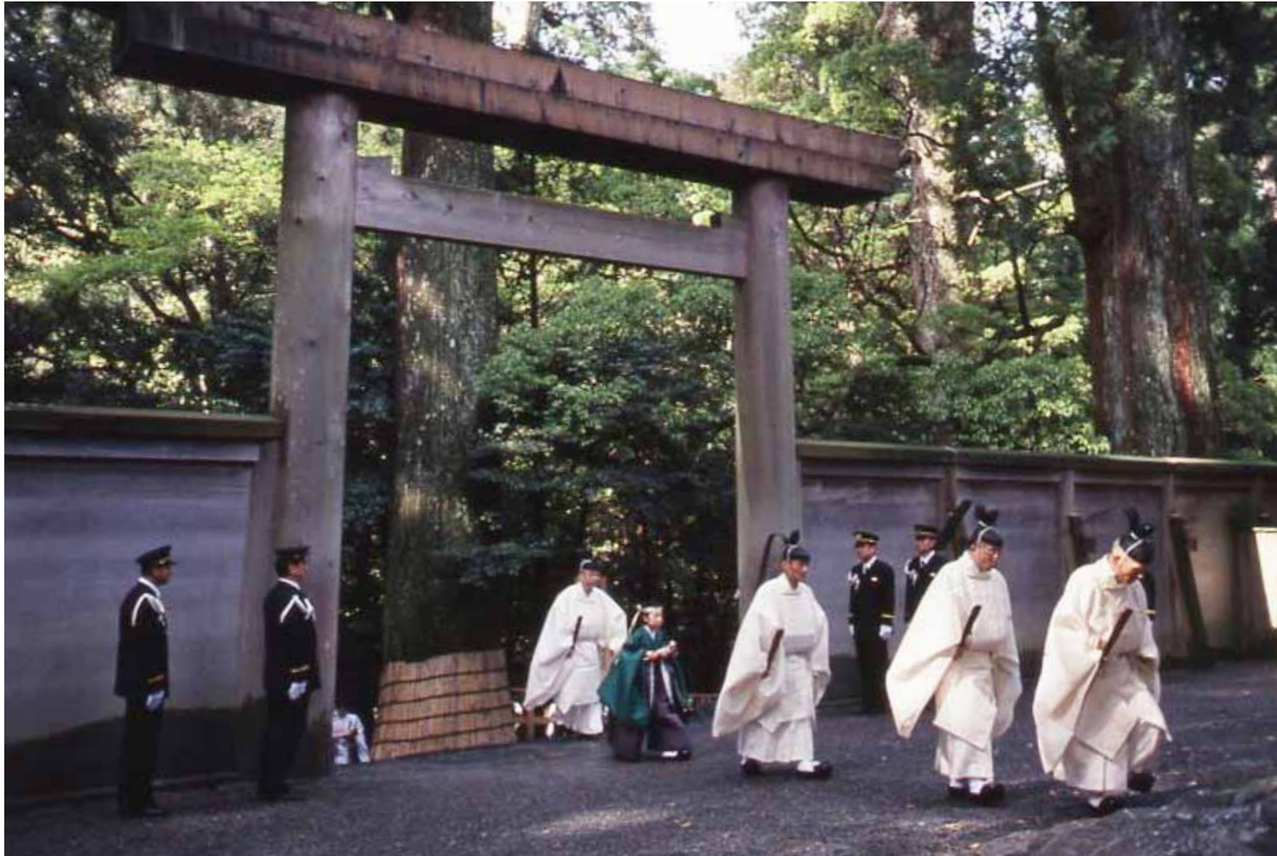
やまぐちさい 山口祭 Yamaguchi-sai