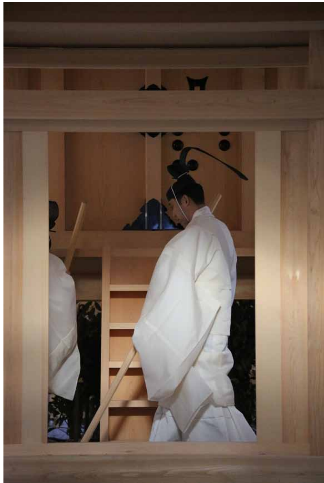
平成27年 (2015) 1月27日 杵築祭 27 January 2015 Kotsuki-sai