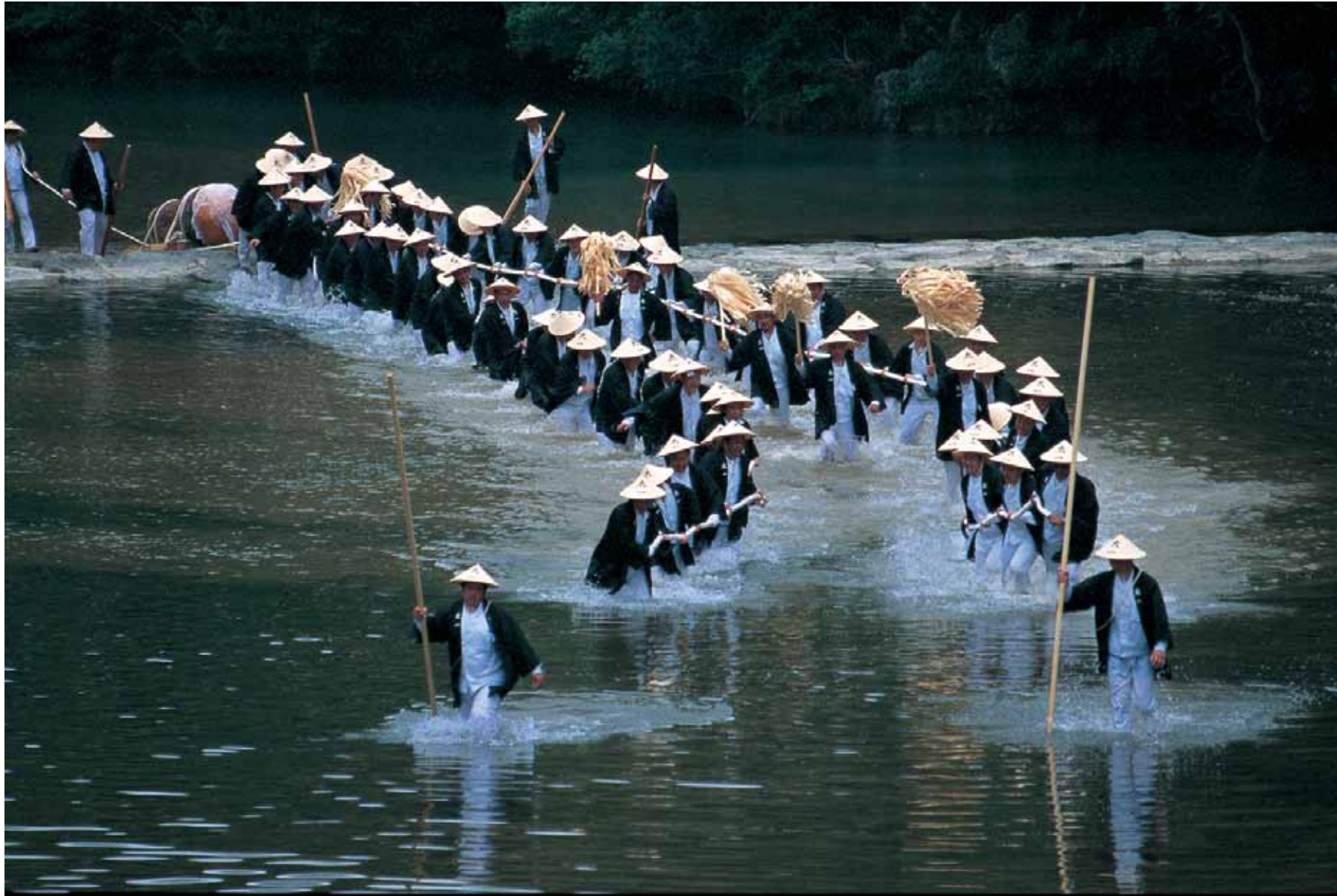
みひしろぎほうえいしき 御樋代木奉曳式 Mihishirogi-hoei-shiki

平成17年(2005)6月9日 内宮 五十鈴川 9 June 2005 The Isuzu River in Naiku